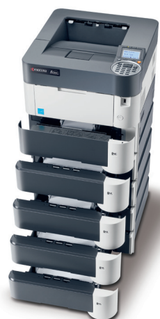
Produkt je zobrazen včetně volitelných doplňků.

JANUS spol. s r.o. – Sarajevská 8 – Praha 2 – tel.: 222 562 246 – fax: 222 563 255 www.janus.cz – info@janus.cz – KYOCERA Document Solutions Europe B.V. – www.kyoceradocumentsolutions.eu FS-4100DN/4200DN/4300DN – Česky – Společnost Janus spol. s r.o. nezaručuje, že uvedené informace jsou zcela přesné. Specifikace produktu mohou být postupem času měněny. Uvedené informace jsou aktuální k datu tisku tohoto datasheetu. Všechny názvy uvedených výrobců a jejich produktů mají registrované obchodní známky nebo registrované obchodní značky svých společností.