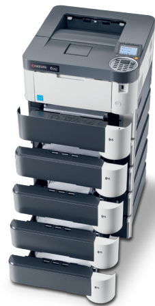
Produkt je zobrazen včetně volitelných doplňků.

JANUS spol. s r.o. – Sarajevská 8 – Praha 2 – tel.: 222 562 246 – fax: 222 563 255 www.janus.cz – info@janus.cz – KYOCERA Document Solutions Europe B.V. – www.kyoceradocumentsolutions.eu FS-2100D/DN – Česky – Společnost Janus spol. s r.o. nezaručuje, že uvedené informace jsou zcela přesné. Specifikace produktu mohou být postupem času měněny. Uvedené informace jsou aktuální k datu tisku tohoto datasheetu. Všechny názvy uvedených výrobců a jejich produktů mají registrované obchodní známky nebo registrované obchodní značky svých společností.